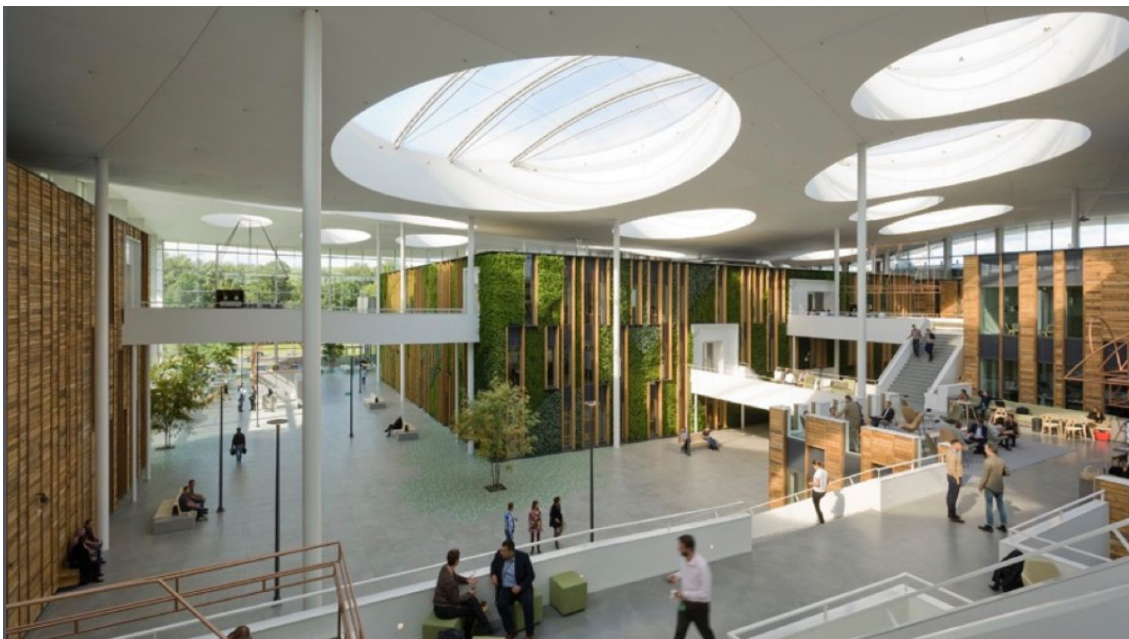
Alliander Innen